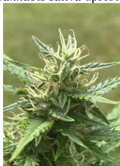
Figura 1 - Espécime de Cannabis sativa apresentando floração feminina.

Dos receptores de endocanabinoides, o CB1 é o mais abundante, é encontrado principalmente no sistema nervoso central (SNC), nos gânglios da base, córtex cerebral, hipocampo, cerebelo e hipotálamo. O CB2 é mais encontrado em células do sistema imune (ASCENÇÃO; LUSTOSA; SILVA, 2016). Grande parte do uso de endocanabinoides é empregado para o controle da dor em doenças como esclerose múltipla e dor oncológica e neuropática (LIMA; ALEXANDRE; SANTOS, 2021). Este capítulo discorre, através da revisão bibliográfica do uso medicinal da Cannabis , sobre as possibilidades de uso dessa polêmica planta em tratamentos veterinários.