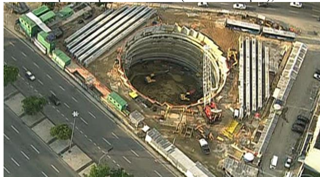
Figura 3: Reservatório de Detenção Praça da Bandeira (em Construção), Rio de Janeiro – RJ- Adaptada.

A figura 3 apresenta um exemplo de reservatório subterrâneo em construção e a figura 4 apresenta este mesmo reservatório pronto.