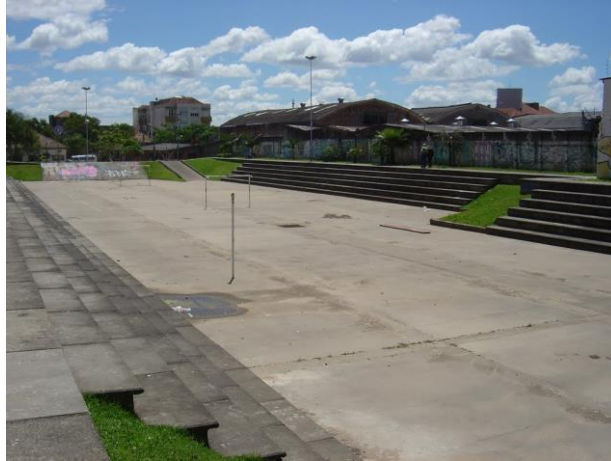
Figura 2: Reservatório de Detenção da Praça Júlio Andreatta (Water Squares), Porto Alegre – RS - Adaptada