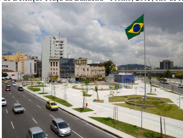
Figura 4: Reservatório de Detenção Praça da Bandeira - Pronto, 2015, Rio de Janeiro – RJ- Adaptada.