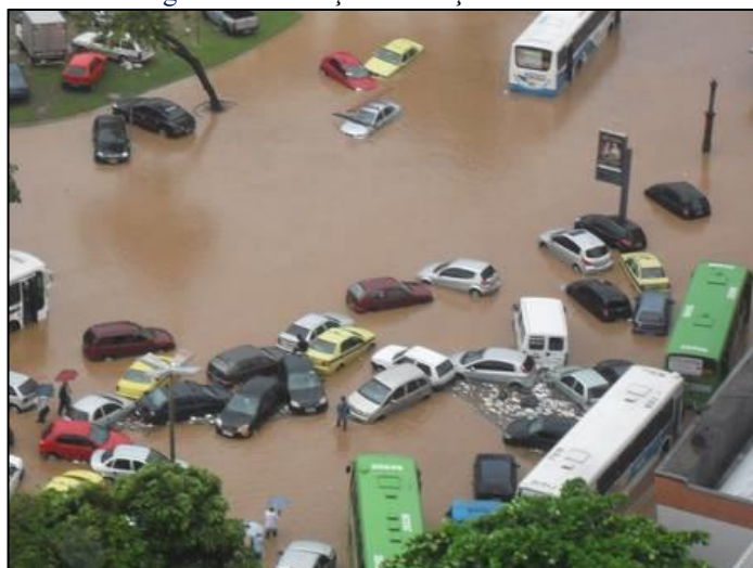
Figura 1: Inundação na Praça da Bandeira.