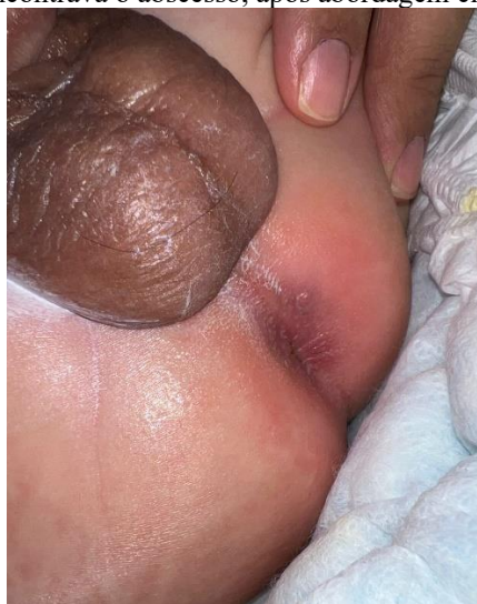
Figura 2: Local onde se encontrava o abscesso, após abordagem cirúrgica e antibioticoterapia.