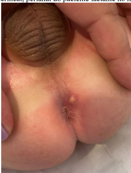
Figura 1: Abscesso perineal, perianal do paciente lactante no momento da admissão.