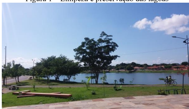
Figura 1 – Limpeza e preservação das lagoas

Os bairros em que estão localizadas as Lagoas do Norte, na época da elaboração do PLN, eram marcados por construções inadequadas e ausência de saneamento. Após a implantação da primeira fase do PLN, é possível verificar, em imagens de junho de 2016, as alterações trazidas pela requalificação urbana realizada, principalmente em relação à limpeza e preservação das margens (Figura 1) e obras de saneamento realizadas (Figura 2).