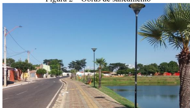
Figura 2 – Obras de saneamento