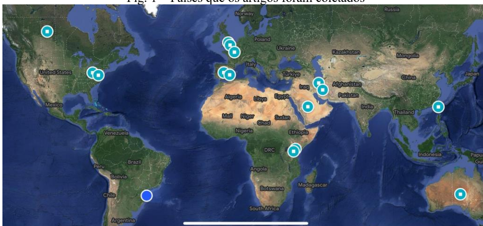
Fig. 1 – Países que os artigos foram coletados

Nos artigos pesquisados, percebeu-se um padrão na problemática abordada, ou seja, os autores também tinham a mesma dúvida do presente trabalho com objeto da pesquisa.