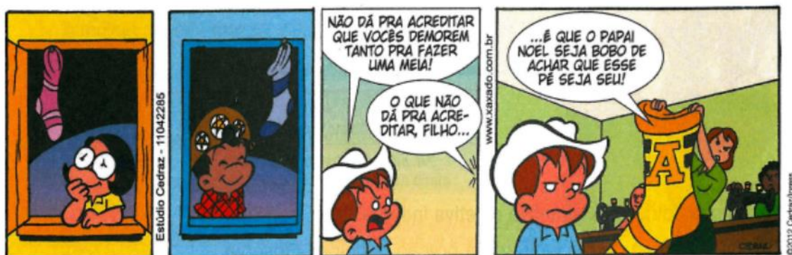
Figura 1: Análise da Tirinha