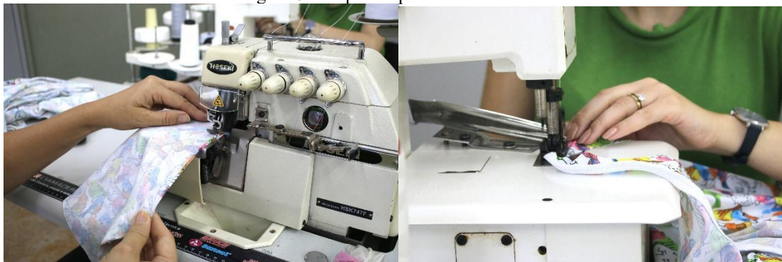
Figura 04: etapas do processo de costura.

Após o corte os lotes são separados e organizados para a montagem na costura. Cada parte da peça precisa ser organizada para as diferentes etapas, desde a costura, tirar linhas, separar, verificar costura, etc. Os participantes do projeto estão atuando nas variadas fases do projeto, as equipes foram divididas por interesse e conhecimento prévio de cada discente. Cabe ressaltar que, todos os integrantes do projeto tiveram oportunidade de acompanhar todas as etapas do projeto. As peças foram costuradas seguindo a sequência operacional de cada produto.