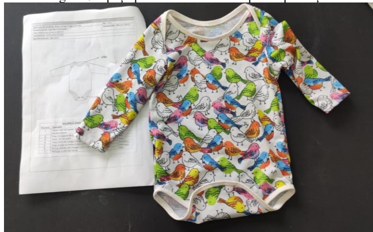
Figura 02: peça piloto e ficha técnica para a produção

Durante o planejamento da coleção foram projetados os produtos a serem desenvolvidos. Foram definidas três peças: calça, body e naninha (Figura 00). Para a confecção das mesmas, definiu-se o processo produtivo a ser executado, conforme exposto no Quadro 1. Nessa etapa, considerou-se os conhecimentos prévios dos alunos, que cursam 1º e 2º série do curso, e também os conhecimentos que seriam necessários que eles tivessem para a execução dos processos.