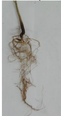
Figura 2: Detalhe do sistema radicular das estacas de Annona squamosa L. mantidas em sistema hidropônico por 90 dias.

Na figura 3 podem ser visualizadas as plantas mantidas em casa de vegetação durante 30 dias após o plantio em solo, mostrando desenvolvimento de novas folhas e crescimento das mudas. Após quatro meses de plantio em solo, as plantas já apresentavam grande número de folhas e tamanho bom para plantio em campo, como pode ser visualizado nas figuras 4 e 5.