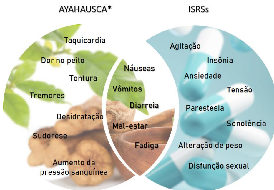
Figura 2: Quadro comparativo dos efeitos adversos mais comuns associados com o uso da Ayahuasca e dos inibidores seletivos de recaptura de 5-HT.

*Efeitos observados a curto prazo. ISRSs: Inibidores Seletivos da Recaptção de Serotonina.