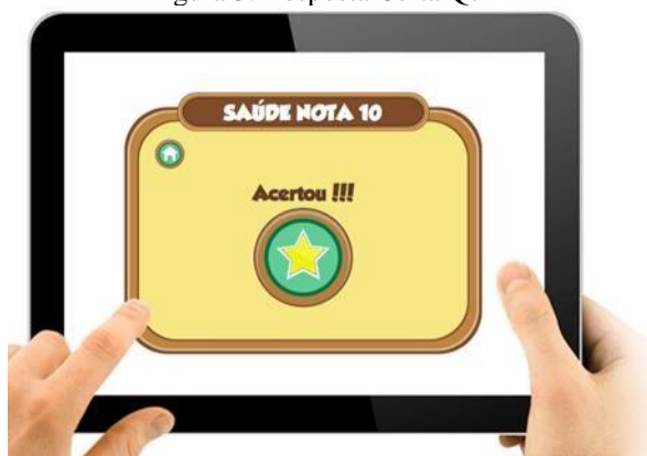
Figura 3: Resposta Certa Quiz