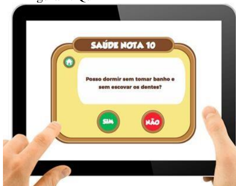
Figura 1: Quizz

Contudo, foi no ano de 2019, que a versão física foi substituída por uma versão digital, com as características de QUIZZ, que: conferia estrelas douradas, ao som de temática musical festiva, quando as perguntas são acertadas pelos jogadores; enquanto, que diante de respostas erradas, verificava-se mensagem de erro, seguida de mensagem estimulante, conforme a ilustração abaixo: