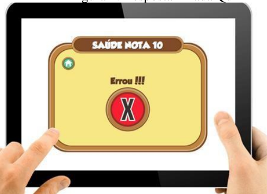
Figura 2: Resposta Errada Quizz