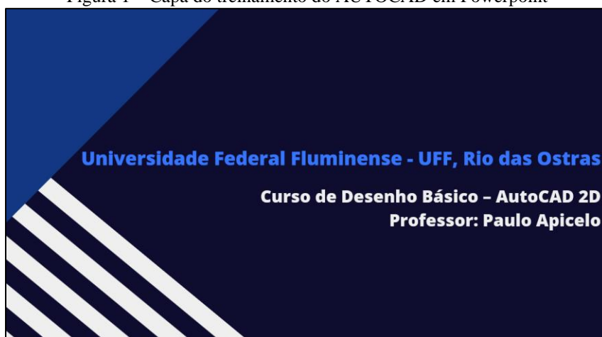
Figura 1 – Capa do treinamento do AUTOCAD em Powerpoint

Como citado anteriormente, outra MAE aplicada foi a Aprendizagem Baseada em Equipe (ABE), que é uma estratégia educacional que tem sido empregada na educação de profissionais, em geral para o desenvolvimento de competências fundamentais, como a responsabilização do aluno pela aquisição do próprio conhecimento, a tomada de decisão e o trabalho colaborativo e efetivo em equipe. Assim, foram