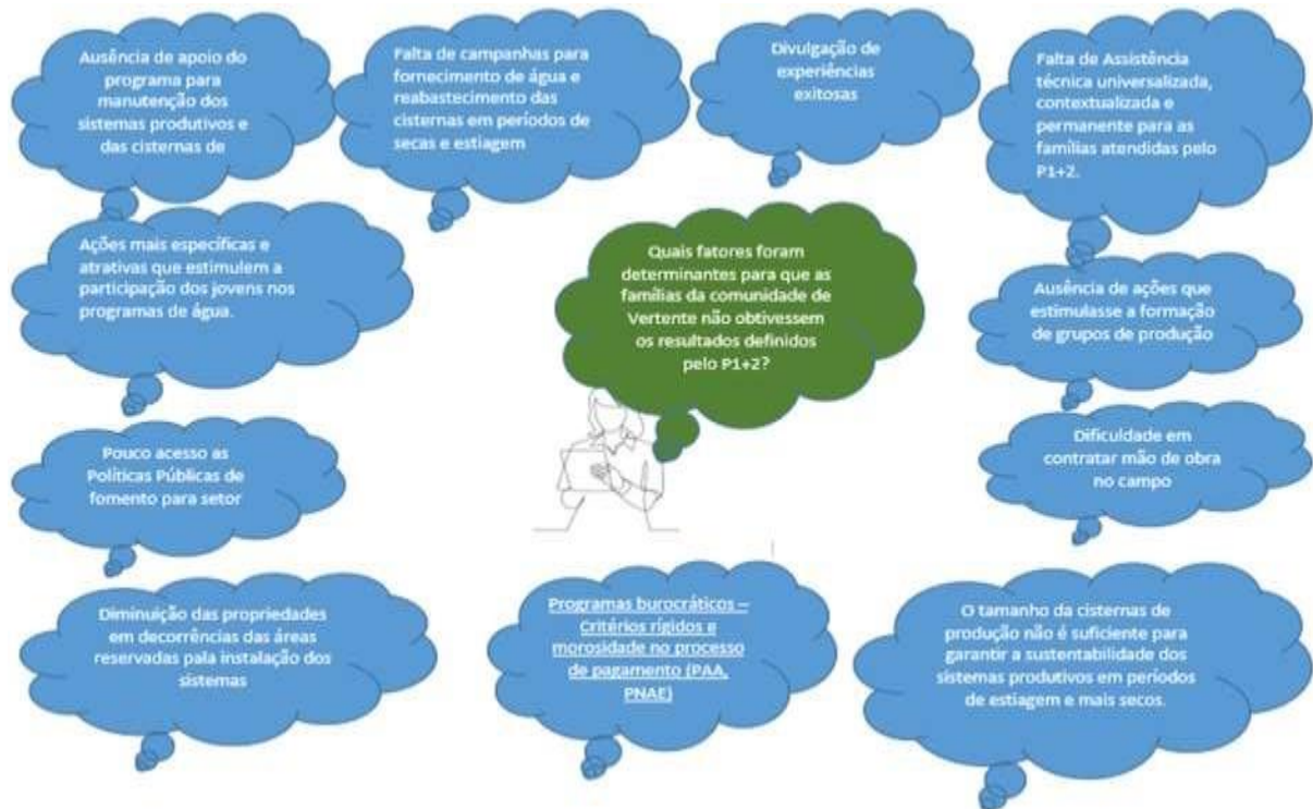
Figura 1 – Sistematização dos problemas apontados pelos agricultores nas rodas de conversas realizadas na comunidade de Vertente, 2024.

meio de matriz de priorização que determinou a gravidade dos problemas (Figura 2) Diante disso, a pesquisa permitiu esboçar, por meio do planejamento participativo, como a comunidade traçará as estratégias e soluções para cada problema.