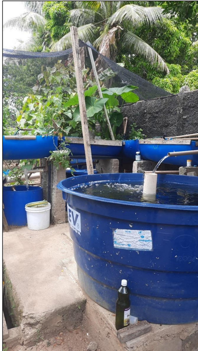
Figura 1 – Projeto piloto Aquaponia