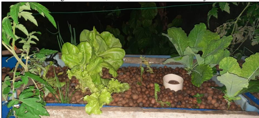
Figura 4 – alface, couve, cebolinha e tomate cereja