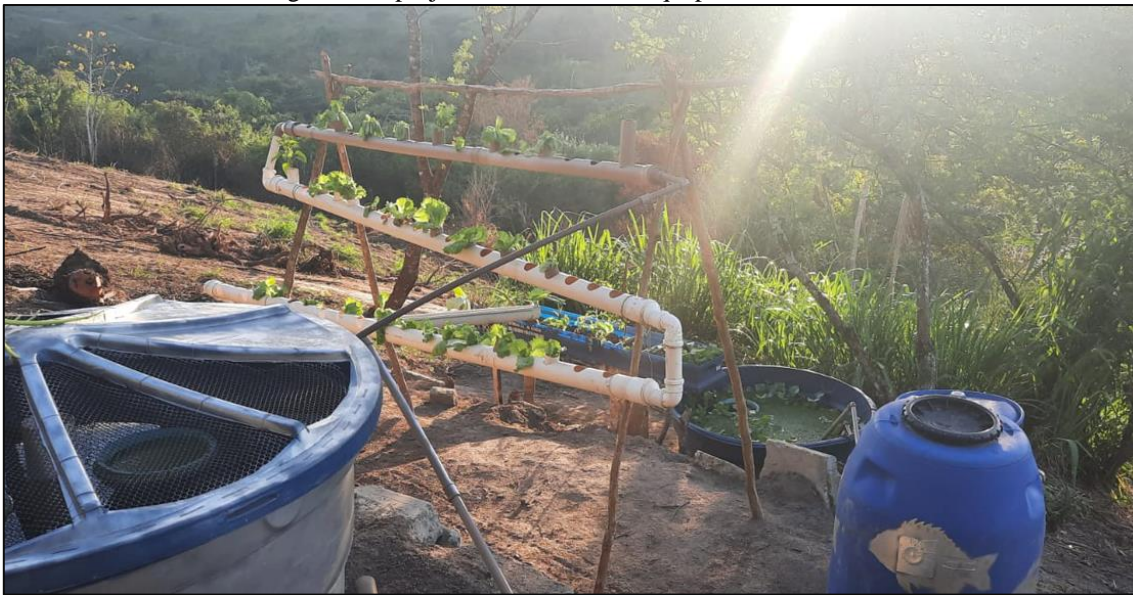
Figura 12 – projeto comunitário de aquaponia residencial