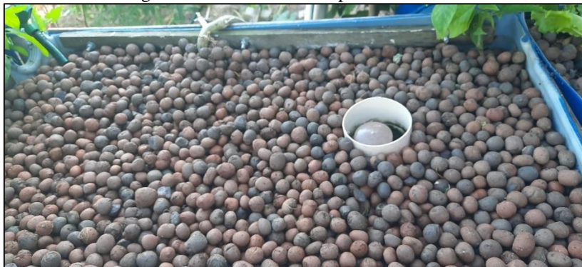
Figura 3 – Cama de cultivo para início testes