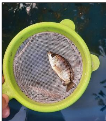
Figura 7 – Peixes da fase de alevinos para fase jovem

Quando o termo desperdício é tratado nesse estudo, podemos falar também no gasto de água para manter as hortaliças de forma convencional, o que gera um custo na produção. Na aquaponia esse gasto com água reduz de 85% a 90%. Sendo só necessária a troca da água quando parâmetros químicos estiverem elevados. A figura 8 nos mostra a qualidade da água em modelo de recirculação conhecido como RAS, sem a necessidade de troca de água e desperdício.