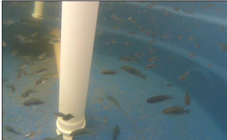
Figura 2 – Alevinos de tilápia