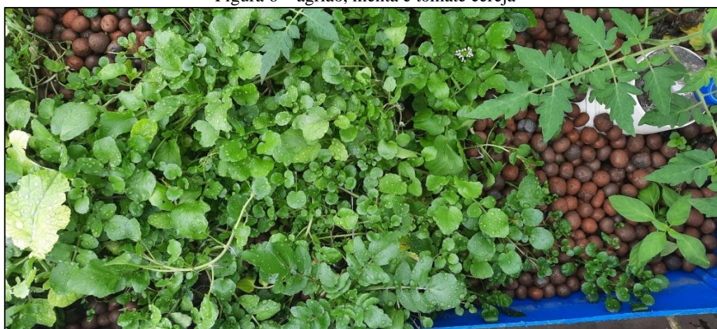
Figura 6 – agrião, menta e tomate cereja