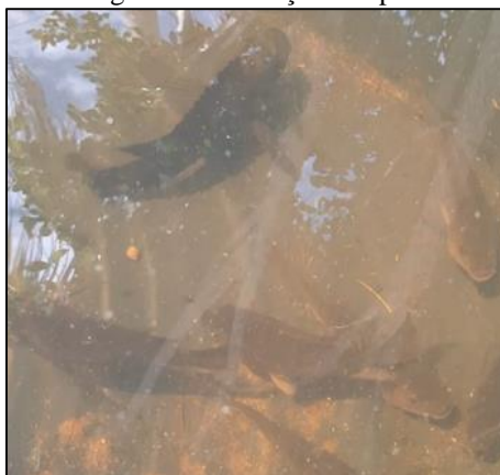
Figura 8 – Produção Tilápias