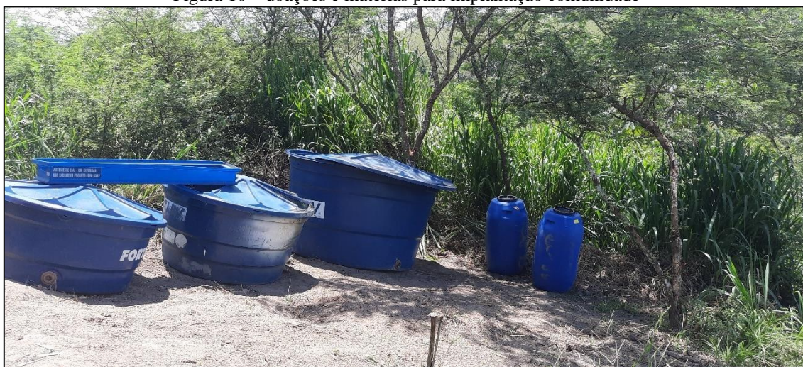
Figura 10 – doações e matérias para implantação comunidade