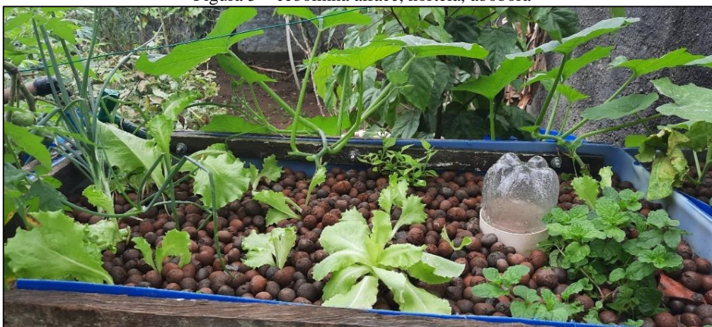
Figura 5 – cebolinha alface, hortelã, abóbora