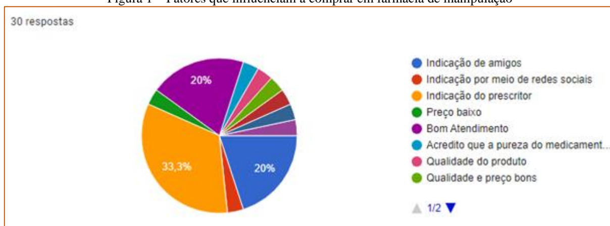
Figura 1 – Fatores que influenciam a comprar em farmácia de manipulação

Muitos fatores influenciam os consumidores a comprarem, com base nisso destacamos alguns que foram mais destacados pelos entrevistados, diante dos dados obtidos é possível observar na figura 1 que a indicação do médico que prescreveu a receita de acordo com 33,3% dos entrevistados é um dos fatores mais importantes para realizar uma compra. Em seguida vem indicação de amigos com 20,0% , e por fim bom atendimento, também com 20% , o restante ficou entre preço baixo, qualidade do produto, dentre outras respostas que podem ser vistas na figura 1.